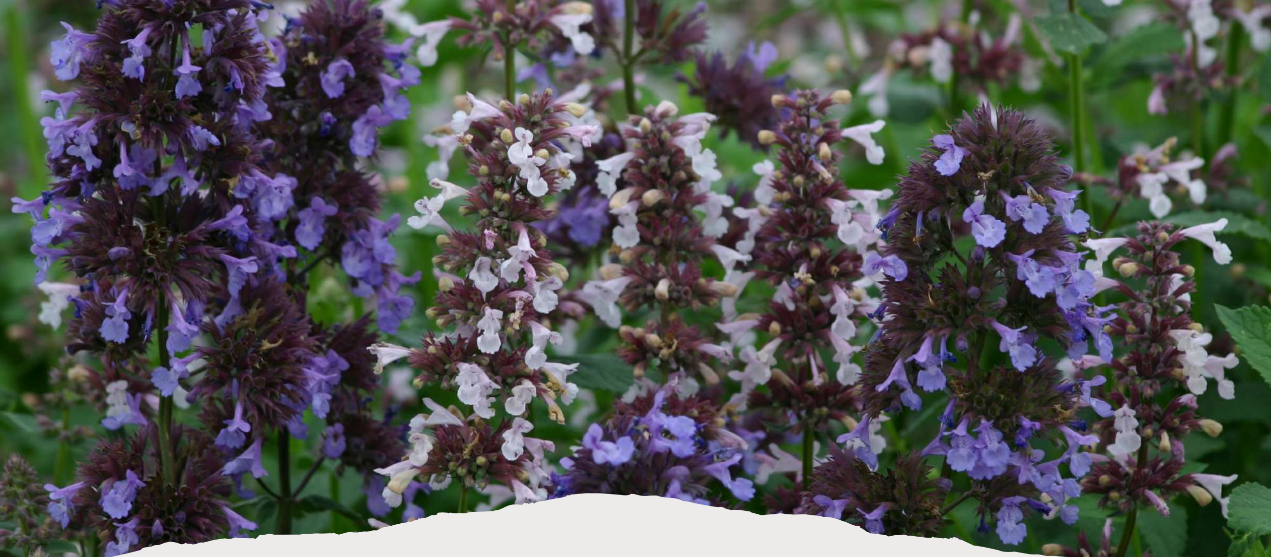
Nepeta grandiflora Border Ballet