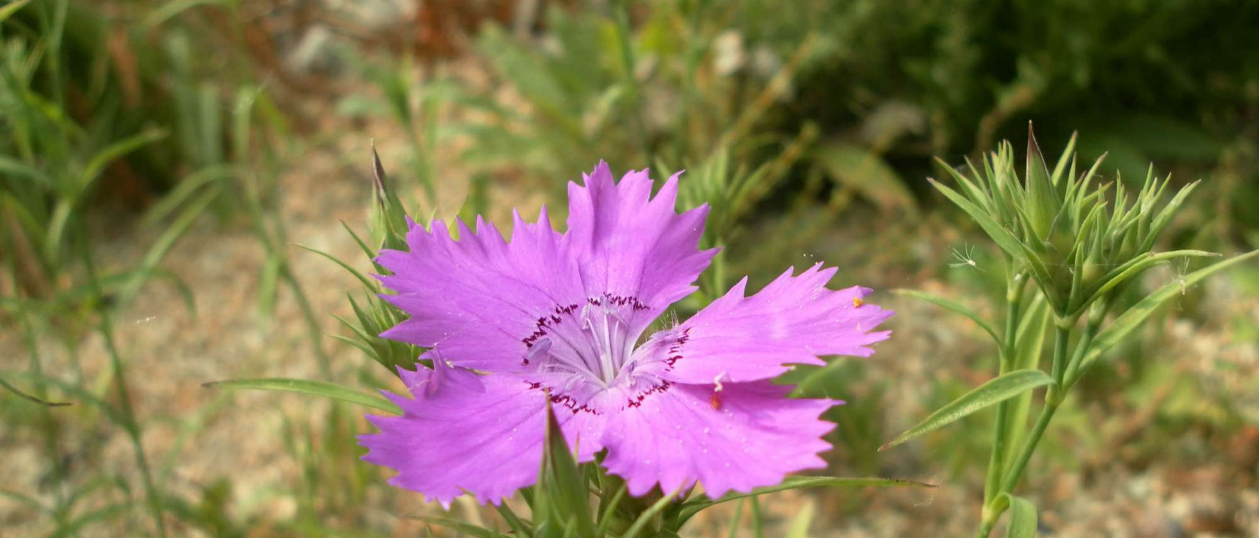
Œillet du fleuve Amour Dianthus amurensis