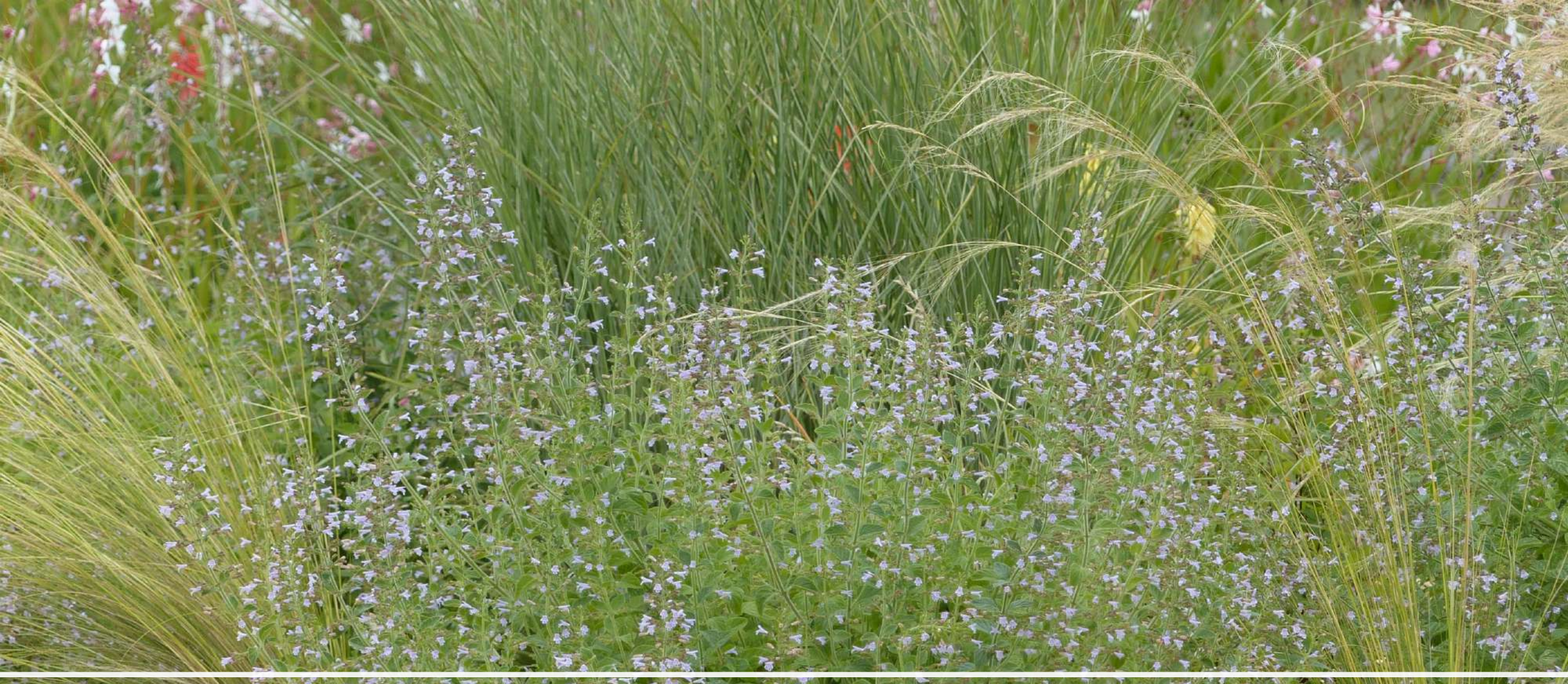
Calamintha nepeta (type)