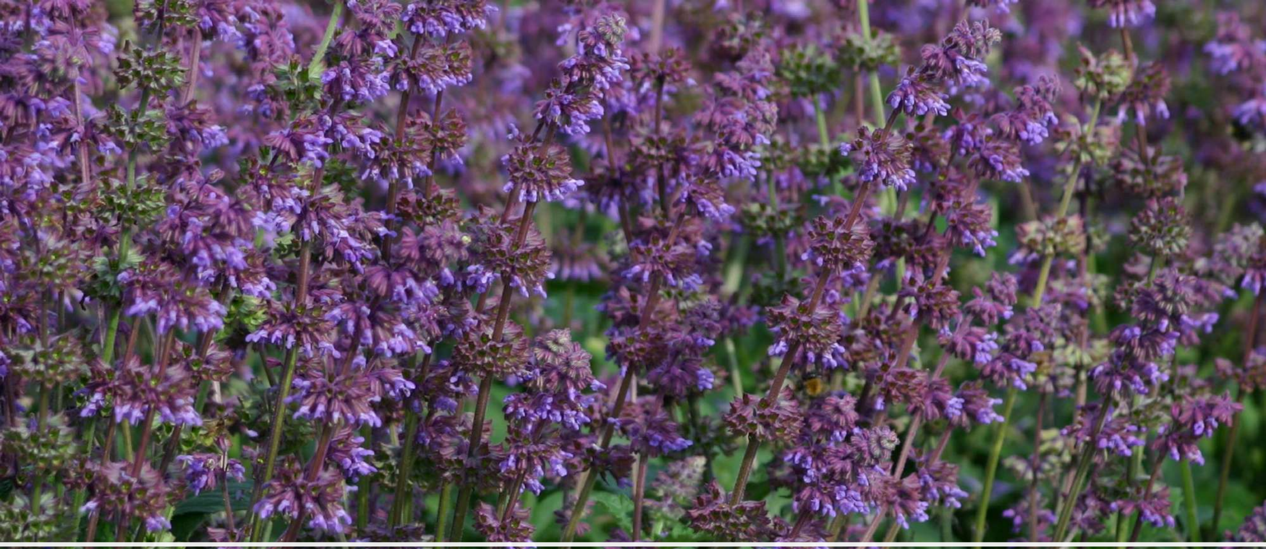
Sauge verticillata Purple Fairy Tale