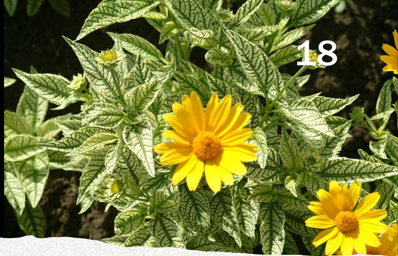
Heliopsis scabra Sunburst

Variante de 'Lorraine Sunshine' Rares plantes à feuillage vert